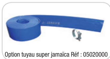
Option tuyau super jamaica Réf : 05020000